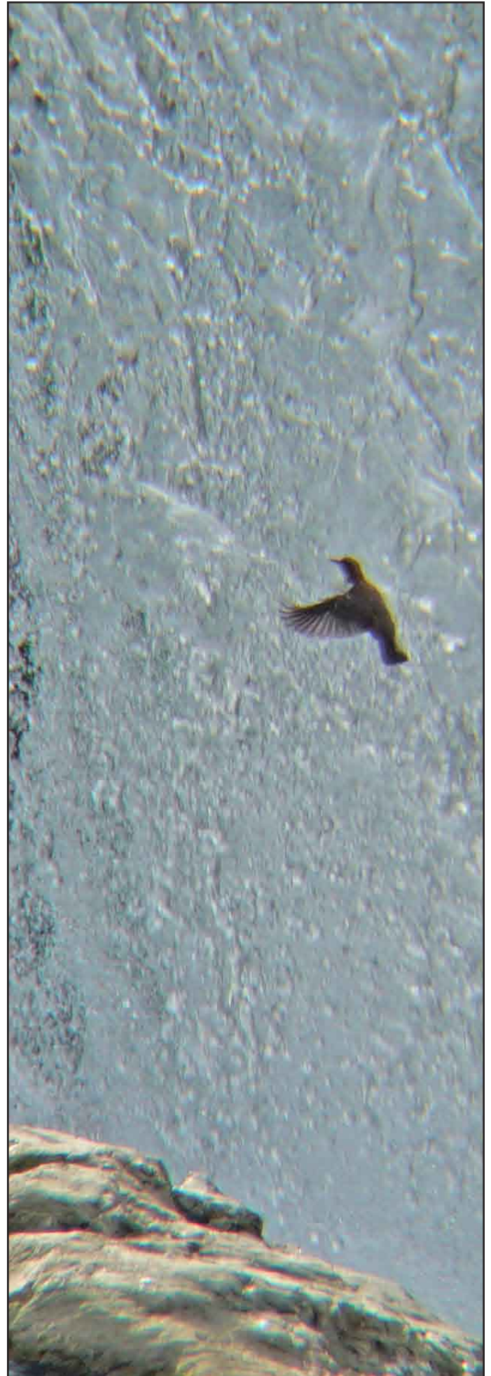
Rodolfo Rigon ottobre 2007